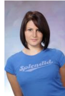
Aerobic- und Dance-Trainerin, Kid-Fit-Fun® Trainerin, Studium der Ernährungswissenschaften

Kursgebühr: 120 € / Kursplatz ist nach Einzahlung der Kursgebühr fixiert!